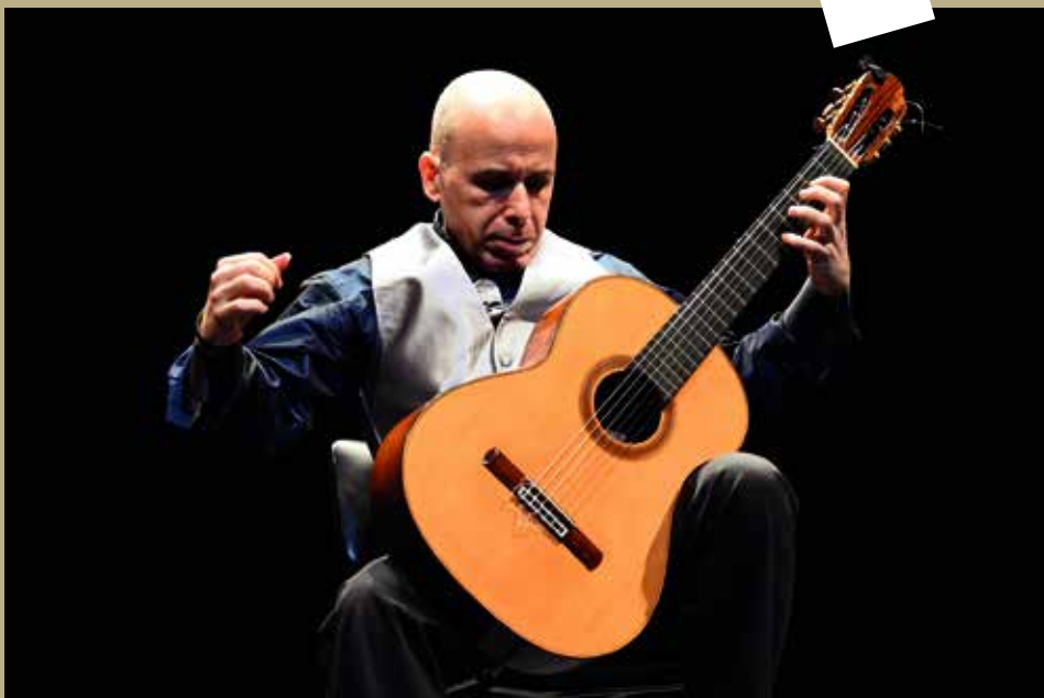
Carles Pons i Altés